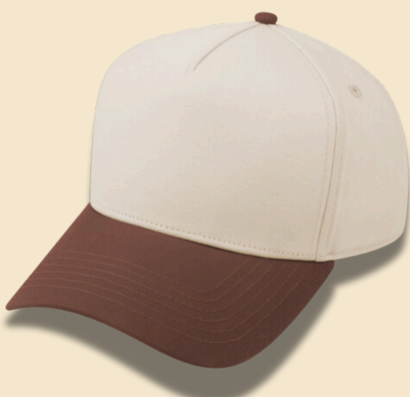
BROWN / BEIGE