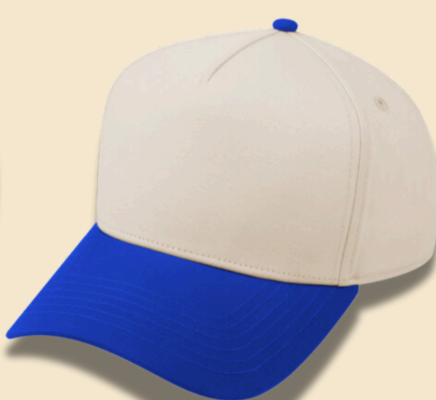
BLUE / BEIGE