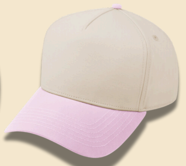
PINK / BEIGE