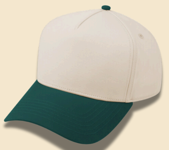
GREEN / BEIGE