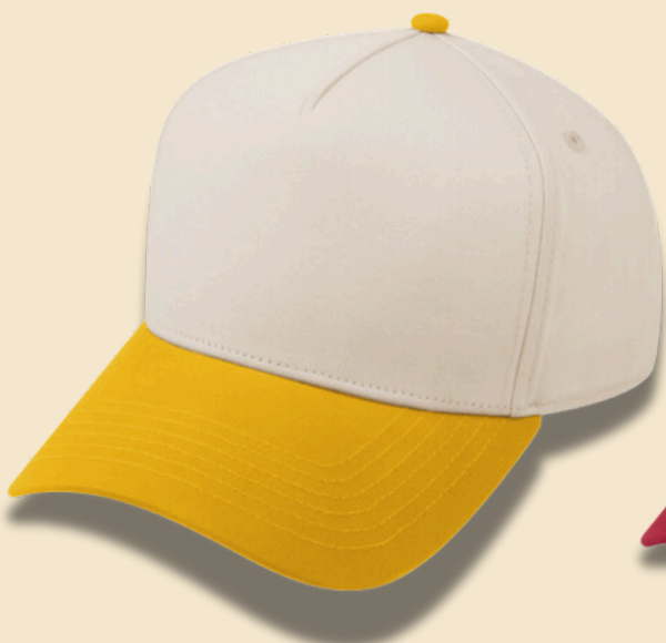
GOLD / BEIGE