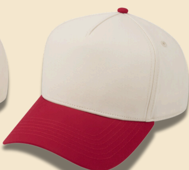
RED / BEIGE