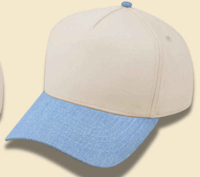
DENIM / BEIGE