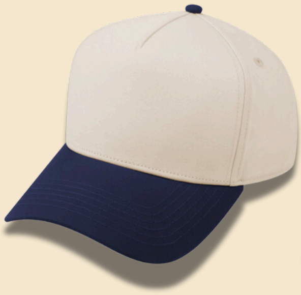
NAVY / BEIGE