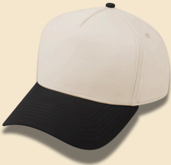
BLACK / BEIGE

SNAPBACK MID PROFILE COTTON SUN HAT ADULT TWO TONE - BEIGE BASED